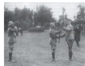
Uitreiking standaard 1928

..... "in de maand mei vochten de twee Regimenten o.a. in de Alblasserwaard en op het Eiland van Dordrecht.