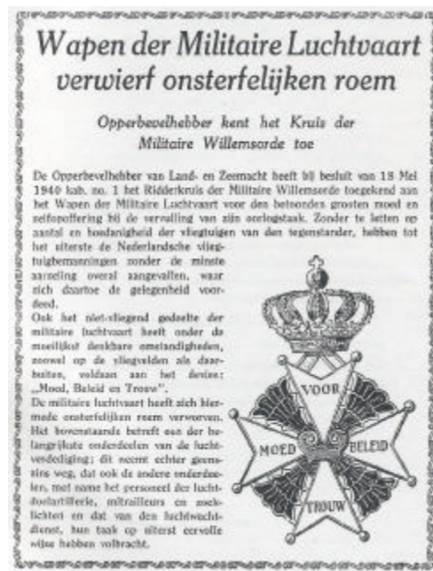
(Beschikking van 18 mei 1940)

Het zou dan ook een grote eer voor ons huidige Korps zijn als het korpsvaandel het vaandelopschrift "Nederland mei 1940" zou mogen voeren.