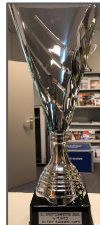
I Tweede plaats "CLAS-bokaal" dames